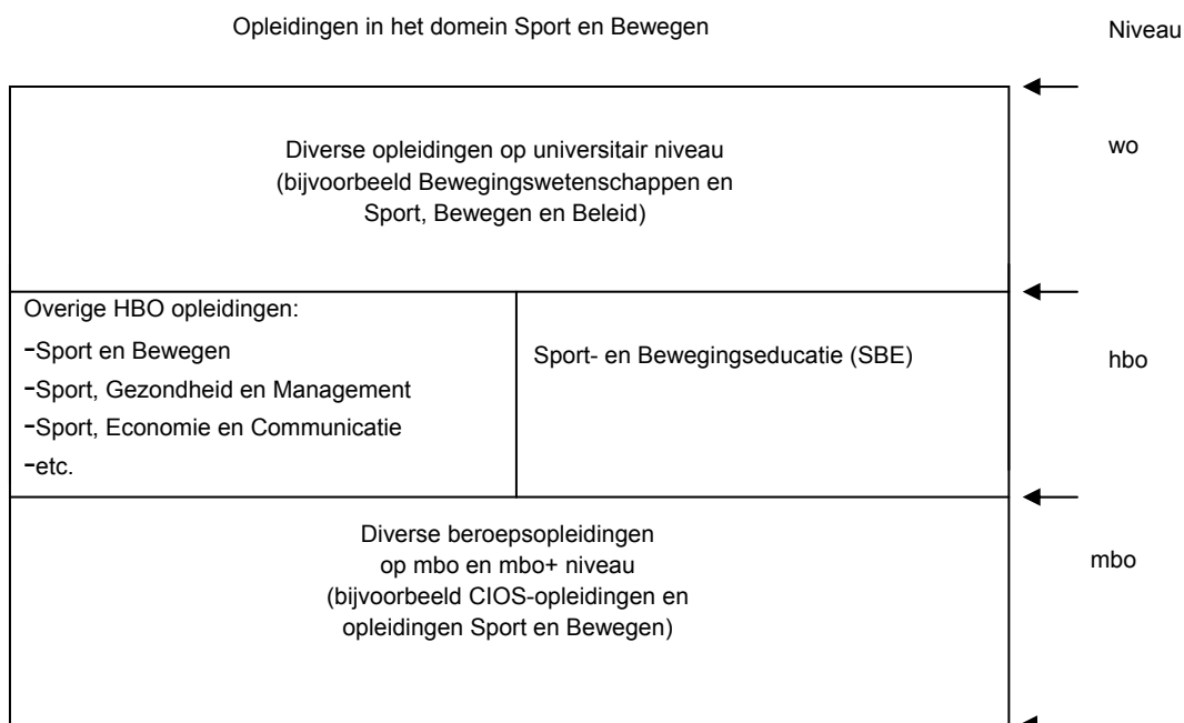
Figuur 1 – Schematisch overzicht opleidingenstructuur Sport en Bewegen